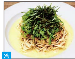
冷 ツナマヨ和えそば ツナ本来の旨味を引き出した上品な味。