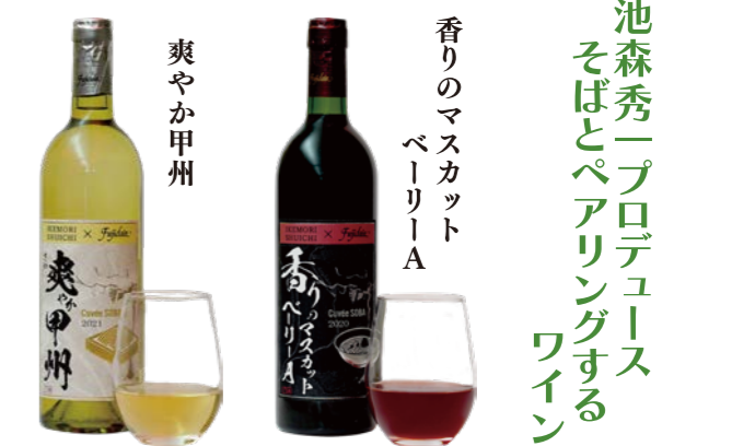
爽やか甲州 香りのマスカット ベリーA 池森秀一プロデュース そばとペアリングする ワイン