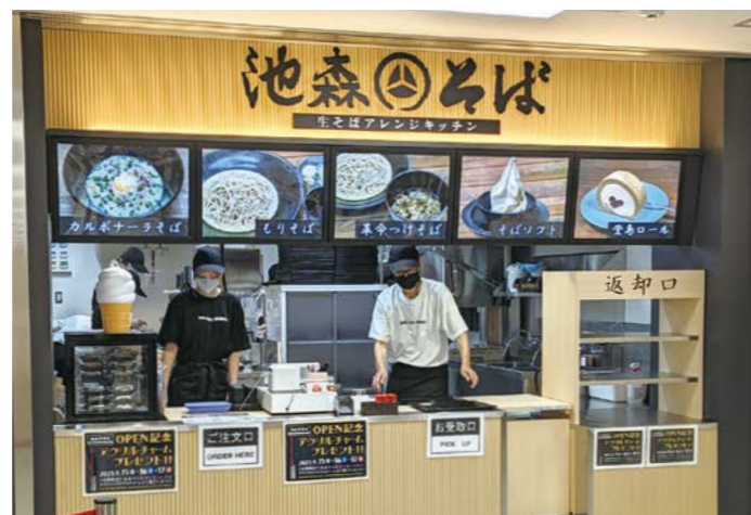
写真：茨城県ヒタチエ店