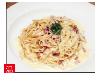
温 ゴルゴンサルシッチャそば ワインに合うイタリアンそば。