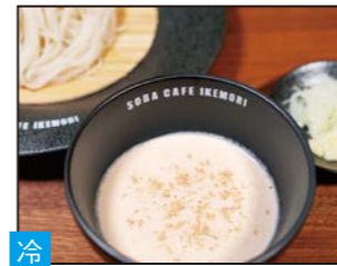
冷 濃厚くみつけそば 豆乳ベースの濃厚なくるみ風味。