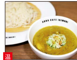
温 海老カレーつけそば豆乳仕立て まるやかな辛さと大きな海老が自慢。