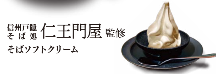
信州戸隠 仁王門屋 監修 そば処 仁王門屋 監修 そばソフトクリーム