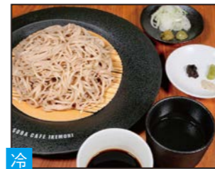
冷 もりそば 池森秀一こだわりの絶品つゆ。