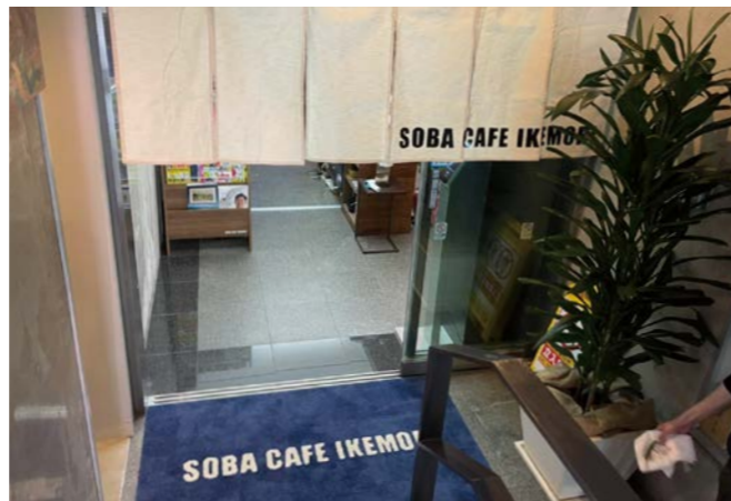
写真：東京都赤坂店